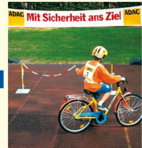
Aufgabe 3 KREISEL Mit der Kette in der linken Hand einen Kreis fahren!