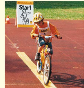
Aufgabe 2 SPURBRETT Nicht vorzeitig vom Spurbrett fahren!