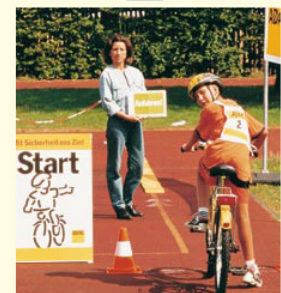
Aufgabe 1 ANFAHREN Erst genau nach links umschauen, dann anfahren.

Ganz wichtig: Möglichst nicht stehend fahren und vor allem nicht abstützen, ausgenommen nach dem Anhalten im »Ziel«.