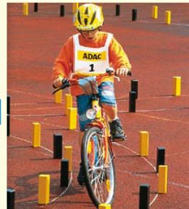
Aufgabe 4 ACHTER Kein Klötzchen umstoßen und nicht aus der Spur fahren!