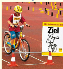
Aufgabe 8 BREMSTEST Vor der Stange anhalten und dann abstützen!