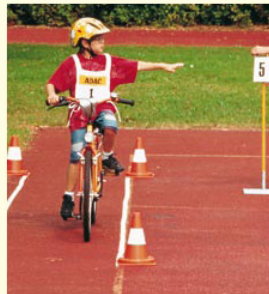
Aufgabe 6 SPURWECHSEL Umschauen, die angezeigte Zahl merken und Handzeichen geben.