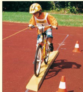
Aufgabe 5 SCHRÄGBRETT Nur nicht vom Schrägbrett abrutschen!