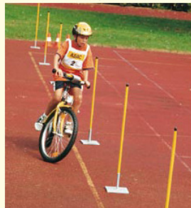
Aufgabe 7 SLALOM Keine Stange berühren oder auslassen!